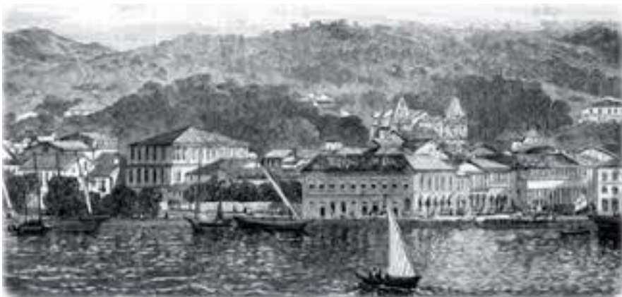
Cachoeira, recôncavo baiano.